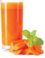
ಒಂದು ಲೋಟ ಹಸಿ ತರಕಾರಿ ರಸವನ್ನು ಕುಡಿಯಿರಿ

ಊಟ - ಊಟದ ಮೊದಲು ಒಂದು ಲೋಟ ಹಸಿ ತರಕಾರಿ ರಸವನ್ನು ಕುಡಿಯಿರಿ ಮತ್ತು ನಿಮ್ಮ ಊಟದಲ್ಲಿ 30% ಕ್ವಿಂತ ಕಡಿಮೆ ಧಾನ್ಯಗಳು (ಅಕ್ಕಿ, ಗೋಧಿ, ರಾಗಿ ಅಥವಾ ಸಿರಿಧಾನ್ಯ) ಮತ್ತು 60% ಕ್ವಿಂತ ಹೆಚ್ಚು ಸೊಪ್ಪು ಹಾಗೂ ತರಕಾರಿಗಳು ಇರಬೇಕು. ಮಾಂಸಪಾಠಿ ಇದ್ದಲ್ಲಿ 20% ಕ್ವಿಂತ ಕಡಿಮೆ ಮೀನು ಅಥವಾ ಕೋಳಿ ಸೇವಿಸಬೇಕು. ಅಕ್ಕಿಯಲ್ಲಿ ಪಿಷ್ಟವನ್ನು (ಗಂಜಿಯನ್ನು) ತೆಗೆಯಬೇಕು (ಅಕ್ಕಿಯನ್ನು ಕುದಿಸಿದ ನಂತರ ಪಿಷ್ಟವನ್ನು ತೆಗೆಯುವ ವಿಧಾನವೆಂದರೆ ನೀರನ್ನು ತೆಗೆಯುವುದು)