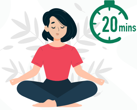
20 ನಿಮಿಷಗಳ ಕಾಲ ಧ್ಯಾನ ಮಾಡಿ

ಯೋಗ- 20 ನಿಮಿಷಗಳ ಕಾಲ ಧ್ಯಾನ ಮಾಡಿ, ಪ್ರಾಣಯಾಮದಲ್ಲಿ ಬಸ್ತಿಕ - 40 ಬಾರಿ, 20 ಬಾರಿ ಅನಲೋಮ ವಿಲೋಮ ಮಾಡಬಹುದು. ಗಮನಿಸಿ: ನಿಮ್ಮ ಅನುಕೂಲ ಮಟ್ಟಕ್ಕೆ ಅನುಗುಣವಾಗಿ ಯೋಗವನ್ನು ಅಭ್ಯಾಸ ಮಾಡಿ, ಮೇಲೆ ತಿಳಿಸಿದ ಮಾಹಿತಿಯು ಕೇವಲ ಒಂದು ಮಾರ್ಗದರ್ಶಿಯಾಗಿದೆ. ನಂತರ ಲಭ್ಯವಿದ್ದಲ್ಲಿ 100 ಮಿಲಿ ಬಾಳೆ ದಿಂಡಿನ ರಸವನ್ನು ತೆಗೆದುಕೊಳ್ಳಿ, ಪಾಕವಿಧಾನಕ್ಕಾಗಿ ಕಿಖಿ ಕೋಡ್ ಪರಿಶೀಲಿಸಿ.