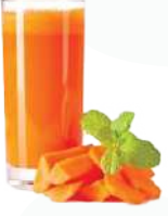
ಒಂದು ಲೋಟ ಹಸಿ ತರಕಾರಿ ರಸವನ್ನು ಕುಡಿಯಿರಿ

ಊಟ - ಊಟದ ಮೊದಲು ಒಂದು ಲೋಟ ಹಸಿ ತರಕಾರಿ ರಸವನ್ನು ಕುಡಿಯಿರಿ ಮತ್ತು ನಿಮ್ಮ ಊಟದಲ್ಲಿ 30% ಕ್ಕಿಂತ ಕಡಿಮೆ ಧಾನ್ಯಗಳು (ಅಕ್ಕಿ, ಗೋಧಿ, ರಾಗಿ ಅಥವಾ ಸಿರಿಧಾನ್ಯ) ಮತ್ತು 60% ಕ್ಕಿಂತ ಹೆಚ್ಚು ಸೊಪ್ಪು ಹಾಗೂ ತರಕಾರಿಗಳು ಇರಬೇಕು. ಮಾಂಸಹಾರಿ ಇದ್ದಲ್ಲಿ 20% ಕ್ಕಿಂತ ಕಡಿಮೆ ಮೀನು ಅಥವಾ ಕೋಳಿ ಸೇವಿಸಬೇಕು. ಅಕ್ಕಿಯಲ್ಲಿ ಪಿಷ್ಟವನ್ನು (ಗಂಜಿಯನ್ನು) ತೆಗೆಯಬೇಕು (ಅಕ್ಕಿಯನ್ನು ಕುದಿಸಿದ ನಂತರ ಪಿಷ್ಟವನ್ನು ತೆಗೆಯುವ ವಿಧಾನವೆಂದರೆ ನೀರನ್ನು ತೆಗೆಯುವುದು)