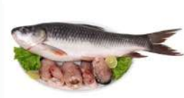
ಮೀನು ಅಥವಾ ಕೋಳಿ