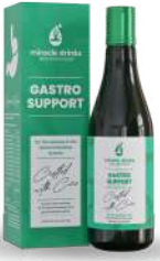
ಗ್ಯಾಸ್ಟ್ರೋ ಸಪೋರ್ಟ್ (S-6) 15 ಮಿಲಿ