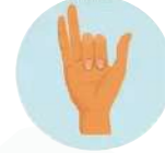
20 ಬಾರಿ ಅನಲೋಮ ವಿಲೋಮ