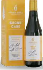
ಶುಗರ್ ಕೇರ್ (S-10) 15 ಮಿಲಿ