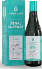
ರೀನಲ್ ಸಪೋರ್ಟ್(S-5) 15 ಮಿಲಿ