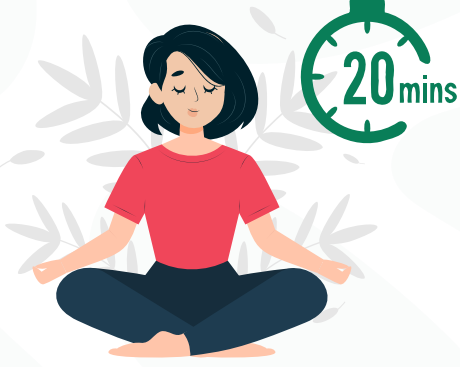
20 ನಿಮಿಷಗಳ ಕಾಲ ಧ್ಯಾನ ಮಾಡಿ

ಯೋಗ- 20 ನಿಮಿಷಗಳ ಕಾಲ ಧ್ಯಾನ ಮಾಡಿ, ಪ್ರಾಣಯಾಮದಲ್ಲಿ ಬಸ್ರಿಕ - 40 ಬಾರಿ, 20 ಬಾರಿ ಅನಲೋಮ ವಿಲೋಮ ಮಾಡಬಹುದು. ಗಮನಿಸಿ: ನಿಮ್ಮ ಅನುಕೂಲ ಮಟ್ಟಕ್ಕೆ ಅನುಗುಣವಾಗಿ ಯೋಗವನ್ನು ಅಭ್ಯಾಸ ಮಾಡಿ, ಮೇಲೆ ತಿಳಿಸಿದ ಮಾಹಿತಿಯು ಕೇವಲ ಒಂದು ಮಾರ್ಗದರ್ಶಿಯಾಗಿದೆ. ನಂತರ ಲಭ್ಯವಿದ್ದಲ್ಲಿ 100 ಮಿಲಿ ಬಾಳೆ ದಿಂಡಿನ ರಸವನ್ನು ತೆಗೆದುಕೊಳ್ಳಿ, ಪಾಕವಿಧಾನಕ್ಕಾಗಿ ಕಿಖಿ ಕೋಡ್ ಪರಿಶೀಲಿಸಿ.