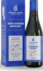
ಆಂಟಿ ಏಜಿಂಗ್(S-1) 15 ಮಿಲಿ