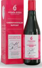
ಕಾರ್ಡಿಯೋವ್ಯಾಕ್ಸುಲಾರ್(S-3) 15 ಮಿಲಿ