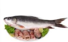
ಮೀನು ಅಥವಾ ಕೋಳಿ