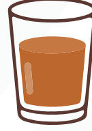
ನೀರಿನಲ್ಲಿ ಬೆರೆಸುವ ಮೂಲಕ ಸೇವಿಸಬಹುದು