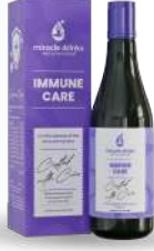
ಇಮ್ಯೂನ್ ಕೇರ್(S-7) 15 ಮಿಲಿ