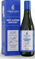
ಆಂಟಿ ಏಜಿಂಗ್(S-1) 15 ಮಿಲಿ