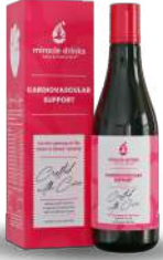
ಕಾರ್ಡಿಯೋವ್ಯಾಸ್ಕುಲಾರ್(S-3) 15 ಮಿಲಿ