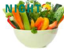
ಸೊಪ್ಪು ಹಾಗೂ ತರಕಾರಿಗಳು