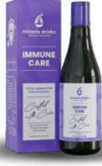
ಇಮ್ಯೂನ್ ಕೇರ್(S-7) 15 ಮಿಲಿ