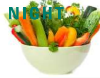
ಸೊಪ್ಪು ಹಾಗೂ ತರಕಾರಿಗಳು