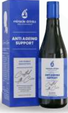
ಆಂಟಿ ಏಜಿಂಗ್(S-1) 15 ಮಿಲಿ