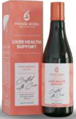
ಲಿವರ್ ಹೆಲ್ತ್ ಸಪೋರ್ಟ್(S-4) 15 ಮಿಲಿ