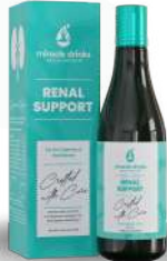
ರೀನಲ್ ಸಪೋರ್ಟ್(S-5) 15 ಮಿಲಿ