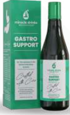
ಗ್ಯಾಸ್ಟ್ರೋ ಸಪೋರ್ಟ್ (S-6) 15 ಮಿಲಿ