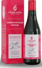
ಕಾರ್ಡಿಯೋವ್ಯಾಕ್ಸುಲಾರ್(S-3) 15 ಮಿಲಿ