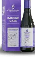
ಇಮ್ಯೂನ್ ಕೇರ್(S-7) 15 ಮಿಲಿ