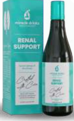
ಆರ್ಥೋ ಸಪೋರ್ಟ್ (S-2) 15 ಮಿಲಿ