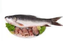
ಮೀನು ಅಥವಾ ಕೋಳಿ