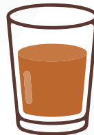
चारों पूरक एक साथ मिलाया जा सकता है