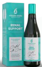
रेनल सपोर्ट (एस-5) 15 एमएल