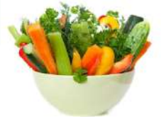
सब्जियाँ और पत्तीदार शाक भाजी