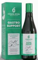
गैस्ट्रो सपोर्ट (एस-6) 15 एमएल

वयस्कों के लिए खाली पेट, गैस्ट्रो सपोर्ट (एस-6), लीवर का स्वास्थ्य समर्थन (एस-4), और रेनल सपोर्ट (एस-5) पूरकों में से प्रत्येक 15 मिलीलीटर पिएं, इस दवाई में 1/2 tea चम्मच एडेमैक्स पाउडर मिलाना चाहिए एक साथ और सेवन किया जाए। बच्चों के लिए 7.5 मिलीलीटर प्रत्येक गैस्ट्रो सपोर्ट (एस-6), लीवर का स्वास्थ्य समर्थन (एस-4), और रेनल सपोर्ट (एस-5) पूरक को एक साथ मिलाकर सेवन किया जा सकता है।