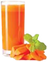
कच्ची सब्जी रस

दोपहर का भोजन – 1/2 गिलास कच्ची सब्जियों का जूस पिएं और सुनिश्चित करें कि आपके भोजन में 30% से कम अनाज (चावल, गेहूँ) शामिल हो और 60% से अधिक भोजन में सब्जियाँ और पत्तेदार सब्जियाँ शामिल हो। 20% मछली या चिकन डी स्कनड। चावल में स्टार्च निकाल देना चाहिए (स्टार्च हटाने की विधि- चावल उबालने के बाद पानी निकाल दीजिए)।