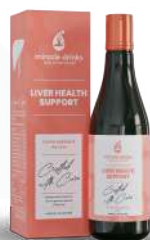
लीवर का स्वास्थ्य समर्थन (एस-4) 15 एमएल