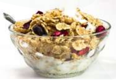
के शामिल अनाज